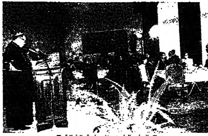
السفير البلوي على منصة الخطبة